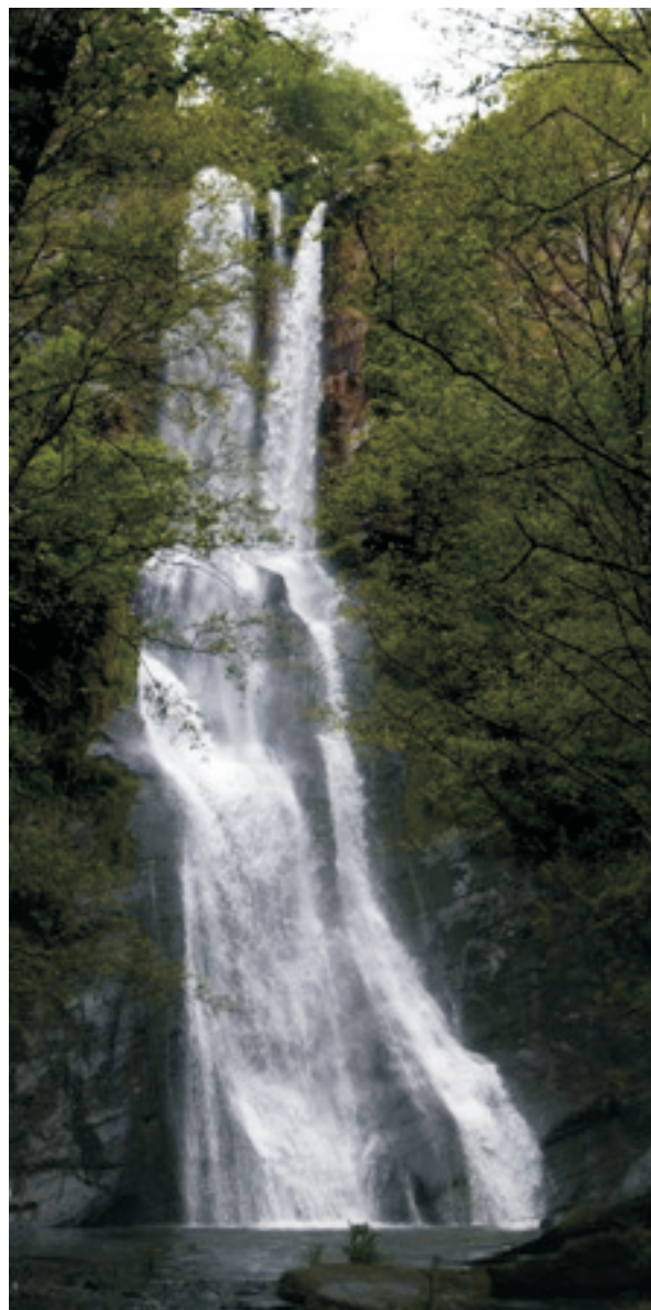
Seimeira de Vilagocende