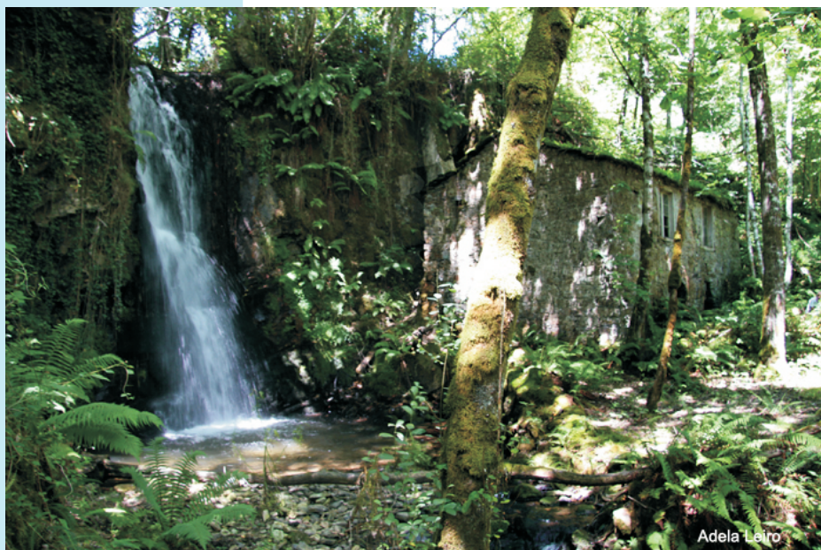
Seimeira de Rozabragada e muíño da Chaila

Actualmente constrúese unha pista pola marxe dereita do río pola que é posible achegarse ás proximidades da ferverza. Desde o punto onde a pista dá un xiro de 90° baixa un carreiro ata o muíño da Chaila e a ferverza.